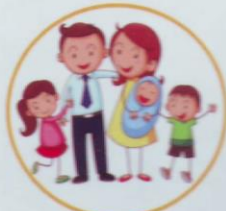
ครอบครัว

ทูลกระหม่อมหญิงอุบลรัตนราชกัญญา สิริวัฒนาพรรณวดี องค์ประธานโครงการ TO BE NUMBER ONE