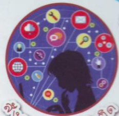
สังคมและยาเสพติด