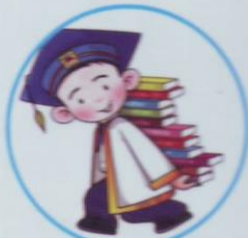
การเรียนรู้