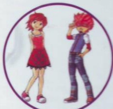
บุคลิกภาพ